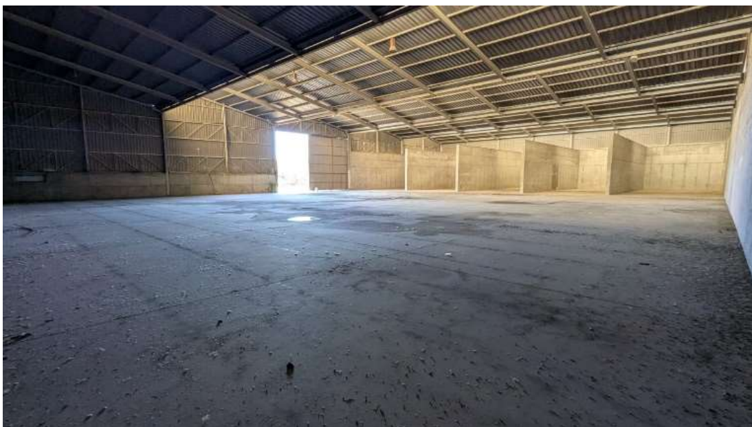
Interior nave con muros de HA interiores, antiguos silos.