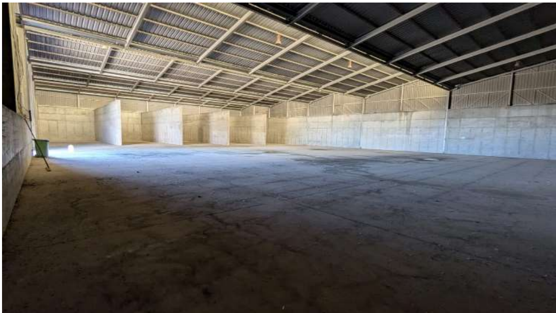
Interior nave, muros, solera, fachadas y cubierta.