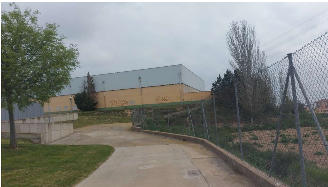
Exterior desde campus UPNA, edificio a reformar.