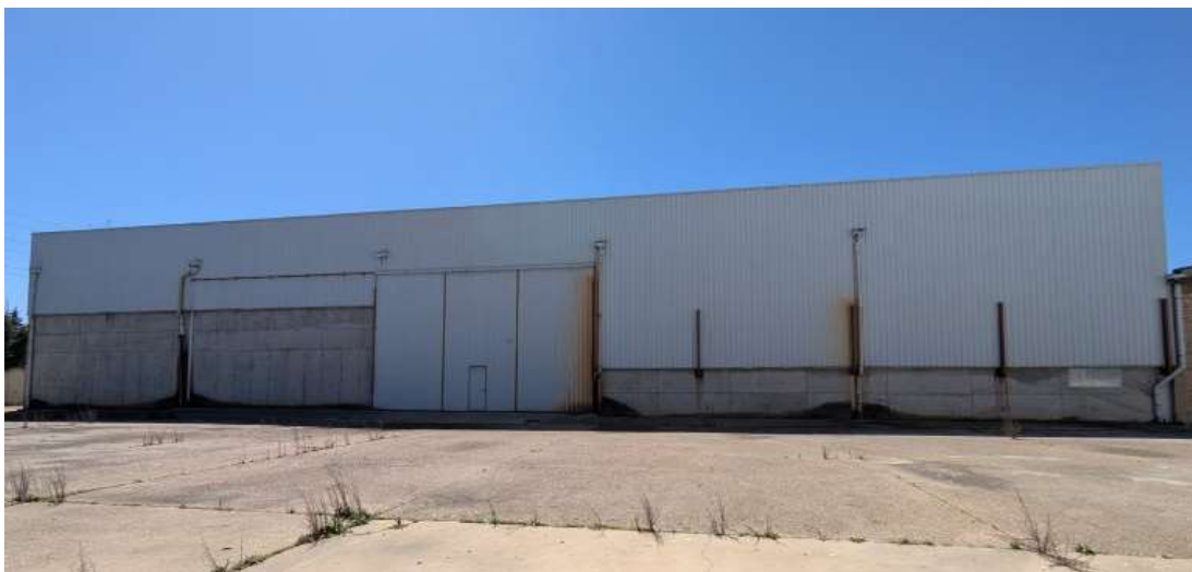
Exterior desde explanada Coop. Labradores, edificio a reformar.